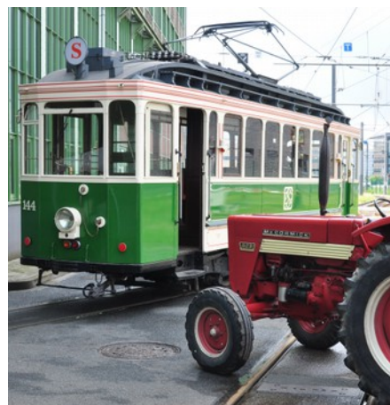
Mehrere historische Straßenbahnen und Busse erbringen den Zubringerverkehr

Straßenbahn-Zubringer: Besucher (Eintritt) und Teilnehmer können unsere Oldtimer-Straßenbahnen kostenlos nutzen. An- und Abfahrt ist an der Sonderhaltestelle „Alte Dreherei“ und in der Stadtmitte. Der genaue Fahrplan und Streckenverlauf wird kurzfristig auf unserer Homepage veröffentlicht.